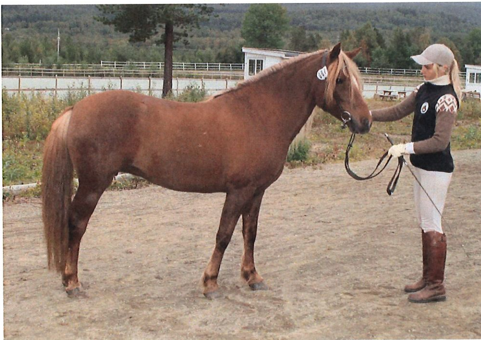
Waltenbergs Frøya. Bilde: Elin Volden Andersen